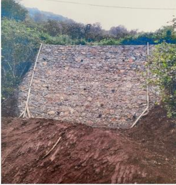
Çetrik Mahallesi Metraj: 210 m3

İlçemizde etkili olan yağmurlarda oluşan altyapı hasarları sonucunda Fidanbaşı ve Çetrik mahallelerinde doğal afetten kaynaklı altyapı hasarlarının giderilmesi amacı ile tekniğine uygun taş duvar imatları yapılmıştır.