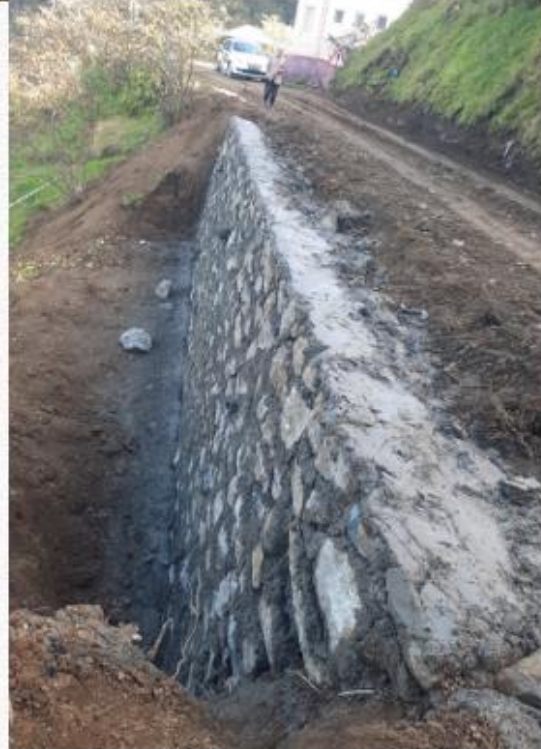
Fidanbaşı Mahallesi Metraj: 51 m3